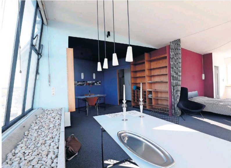
„Prof. Scharoun/v. Plato“ – so steht es heute noch am Klingelschild. Schräge Atelierfenster sollten viel Licht, aber keine direkte Sonne einlassen. Das hölzerne Bücherregal stammt noch aus dem Scharoun'schen Haushalt.

Tatsächlich, das Klingeltableau am Heilmannring 66A zeigt für das achte Ge-